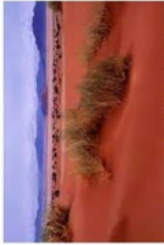
Landscape between the Kalahari and Namib deserts

We advise shots against hepatitis. For the rest consult a travel-related health clinic. There may be no need for malaria prophylaxis, as at the time of our expedition, the winter season will start in Namibia.