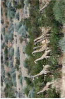
North Namibian unfenced wildlife

Participants will meet in Windhoek, the capital of Namibia. This is where we will pick-up the terrain vehicles and get familiarised with them. During the first week we go SOUTH, will be focusing on the Kalahari and Namib deserts and get used to drive off road... We will have access to private properties (farms) with beautiful views; will meet locals & have chance to interact with them. During the second week we will set off to the wild NORTH (Angola border), to photograph local Himbas and Herero & the unfenced wildlife.